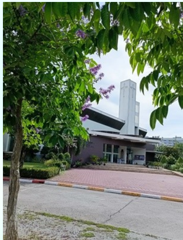
วัดบางแสนหน้าร้อน ตะแบกบาน